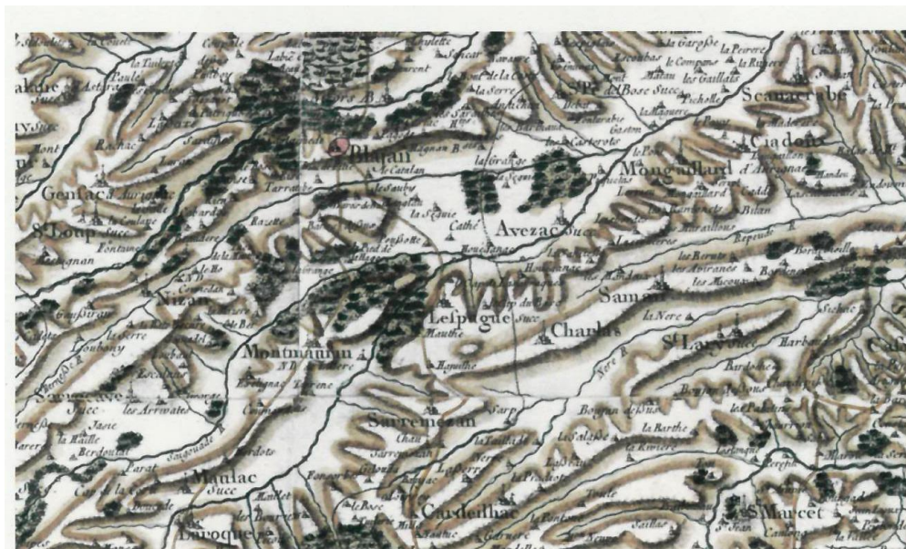
Carte Cassini, XVIII e siècle